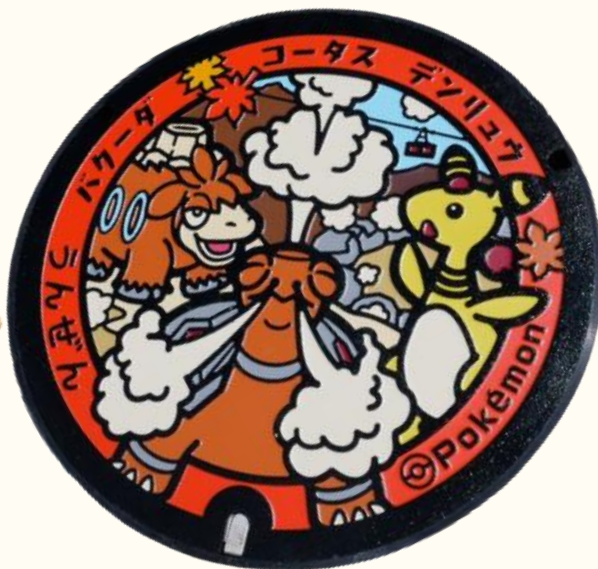
雲仙温泉街の「極楽公園」に設置されたポケふた 左からバクーダ、コータス、デンリュウが描かれている