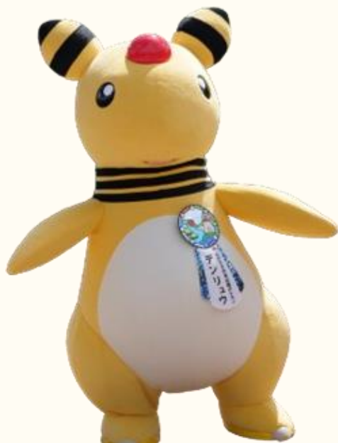
「ながさき未来応援ポケモン」のデンリュウ

雲仙のポケふたには、「コータス」「バクーダ」そして「デンリュウ」が描かれています。雲仙を象徴する火山を連想させるポケモンとして選ばれました。実はこのポケふたに、「ながさき未来応援ポケモン」に認定されたデンリュウを、お土産のパッケージなどに使用することができるようになりました。ポケモンの世界観を損なうものへの利用は不可(お酒や生肉・魚などの加工度が低いもの)ですが、PRとして使用されたい方は一度、長崎県ながさきPR戦略課までお尋ねください。