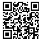
NCCニュース映像は上記より