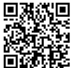
コンテンツ造成の様子は上記より 2